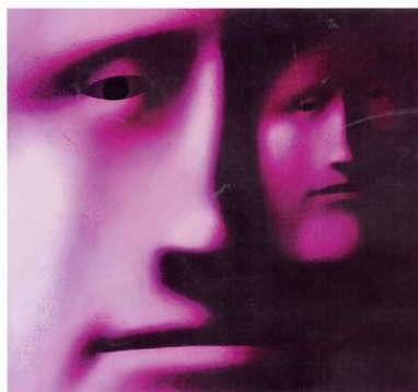
Двулицый 2341 x 2603 px.