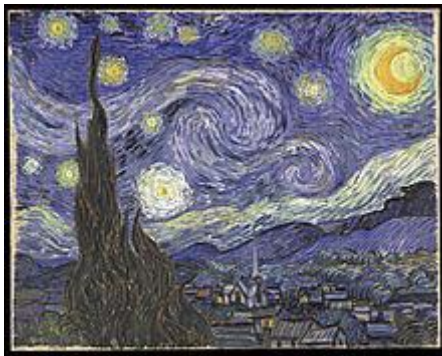
Винсент Ван Гог. Звёздная ночь, 1889 г.

Сюрреализм (фр. surréalisme — сверхреализм) — направление в искусстве, сформировавшееся к началу 1920-х во Франции. Отличается использованием аллюзий и парадоксальных сочетаний форм.