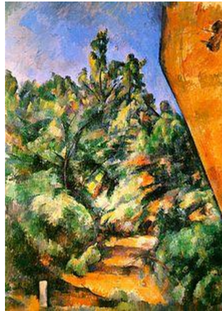
Поль Сезанн. Бибемус, красная скала, 1897 г.

Сюрреализм в фотографии получил признание благодаря пионерским работам Филиппа Халсмана.