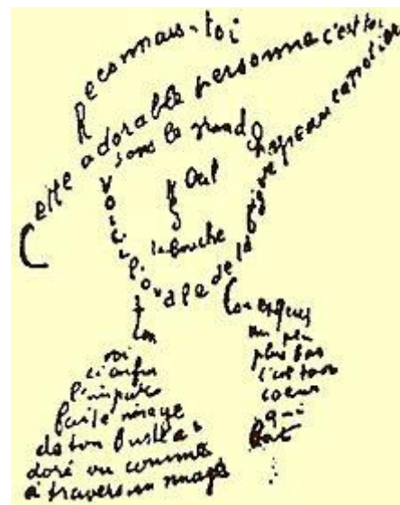
Gedicht aus den Calligrammes

Основное понятие сюрреализма, сюрреальность — совмещение сна и реальности